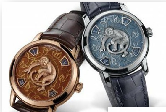
۵- وشرون کنستانت